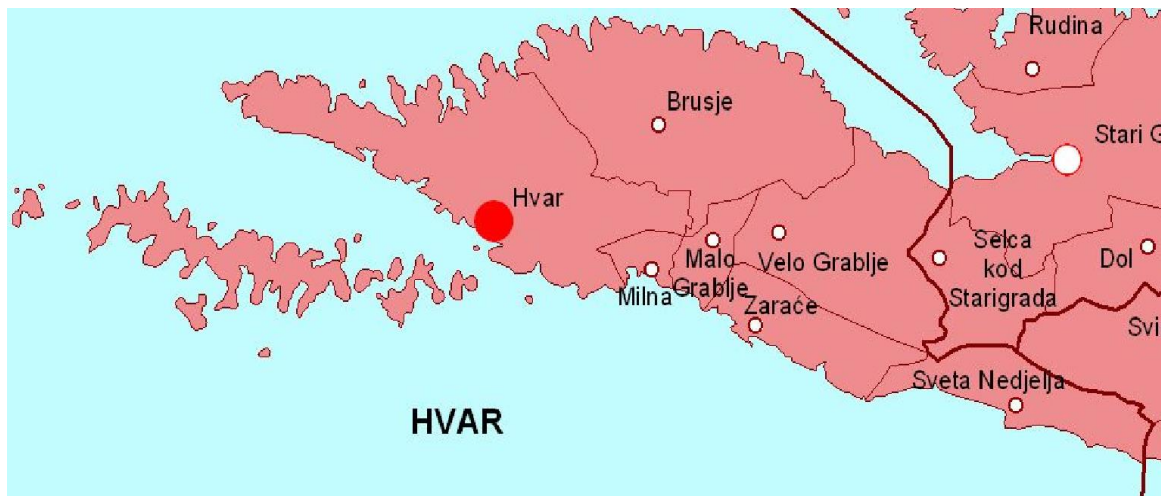
Slika 1. Položaj grada Hvara