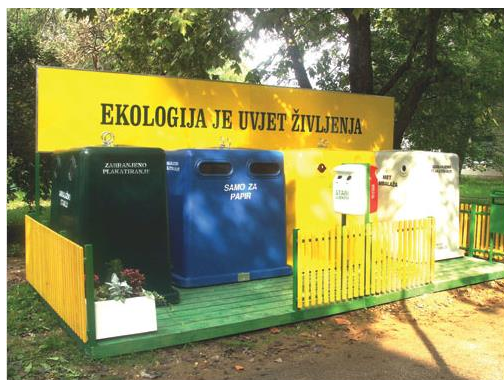
Slika 2. Primjer zelenog otoka

Grad Hvar će postaviti u prvoj fazi osam zelenih otoka (24 posuda), čime će se zadovoljiti zahtjevi postavljeni u Planu gospodarenja otpadom Splitsko-dalmatinske županije. Međutim, s obzirom na raštrkanost naselja grada Hvara i na financijske mogućnosti, do kraja 2016. godine postaviti će se još 43 zelena otoka. Osim spremnika za papir i karton, staklo, plastičnu i metalnu ambalažu, potrebno je osigurati i spremnik za tekstil.