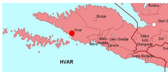
Slika 1. Položaj grada Hvara

Problem ukupnog razvoja Grada Hvara je doseljavanje stanovnika u naselje Hvar, uz naglašenu depopulaciju naselja u unutrašnjosti otoka. Pri tome je rast izgradnje brži od rasta stanovništva, pa se na obalnom području koncentrirala izgradnja velikog broja stambenih objekata te objekata koji se koriste za turizam ili kao kuće za odmor. Ovu izgradnju ne prati adekvatna izgradnja infrastrukturnih sustava, niti razvoj gospodarskih djelatnosti. Problem infrastrukturnog opremanja ovog područja je i velika razlika u potrebnim kapacitetima u ljetnom razdoblju u odnosu na ostatak godine.